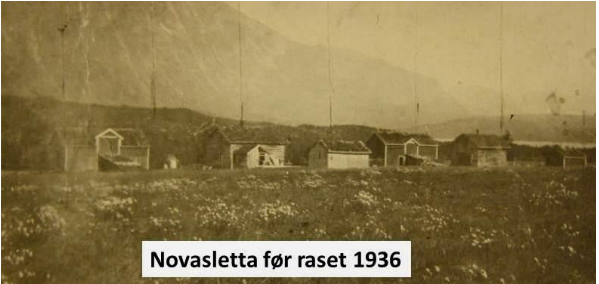
Novasletta før raset 1936