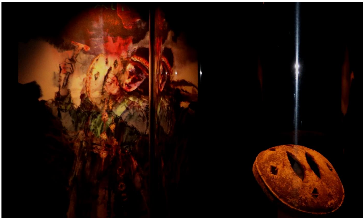
Sentralt i utstillingen er den unike skåltrommen fra Hilleshamn (Hilssá meavrresgárri).