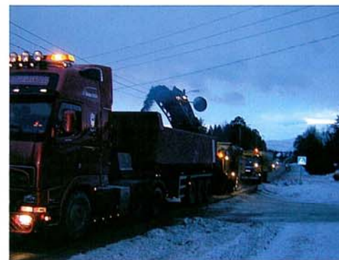
Mesta i arbeid på fv. 13.

2 ganger pga kulde mellom 10–17C. Dette pga vannet som skal avkjøle fresetrommel frøs til is i rørene. Som sagt alle gode ting er 3.