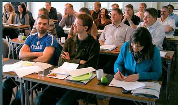
Faglig på Thon Nordlys Hotel i Bodø.

Tema som stod på programmet var Statens vegvesen som samfunnsaktør, etikk og verdigrunnlag, presentasjon av avdelinger/distrikt, kommunikasjon og omdømme, personalpolitikk, HMS samt litt informasjon om