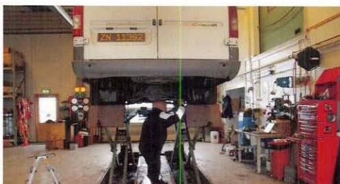
Men først og fremst kontroll av kjøretøy – Arnulf in action!