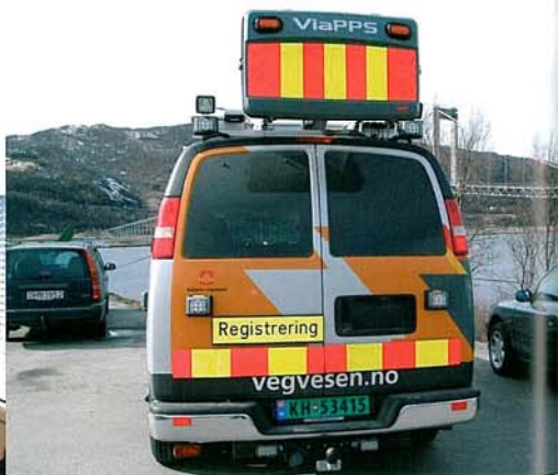
Ny type målebil med den nye PPS-scanneren fotografert like ved Tjeldsundbrua.