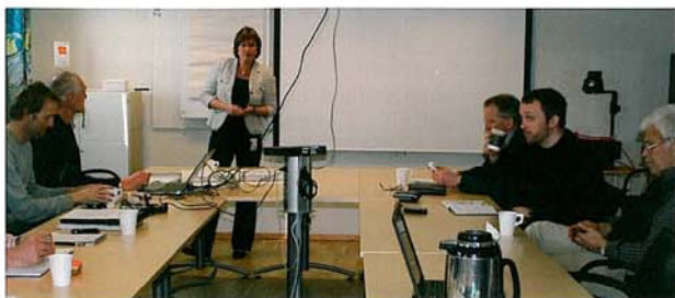
Fra møte i med prosjekt- og styringsgruppa

oppsummerte arbeidet så langt og presenterte utfordringer for det videre arbeidet.