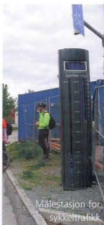
Målestasjon for sykkeltrafikk

Onsdag den 20. mai var ei gruppe med personer fra regionvegkontoret i Bodø, Midtre Troms distrikt, Salten distrikt og Bodø kommune på studietur i Trondheim. Formålet med turen var å se på kollektivtiltak og sykkelløsninger der. De flinke mannfolkene på Vegkontoret i Trondheim hadde lagt opp til informasjon om hvordan de ordner både kollektivtrafikken og sykkeltrafikken. Etter informasjon innendørs om sammenhengende kollektivfelt på de viktigste innfartsvegene og om sykkelfelt i byen bar det ut på befaring. Befaringen ble foretatt på sykkel. Etter en del justering av sykler og hjelmer, samt stille banning over å ha glemt egen vest – som er mye mindre enn den en av oss fikk låne – bar det ut i gatene. Deilig vær og ikke minst gode løsninger på både kollektiv og på sykkelfelt bidro til en spennende og givende tur. Om det fantes noen overganger og feltskifter som ikke var helt slik de skulle være, ga befaringen likevel nok til å gi arbeidet med både kollektivfelt og sykkelfelt et stort puff (for ikke å si tråkk!) forover. Løsningene ligger der foran oss, så utfordringen fremover blir å tørre å gjøre det, samt få kommunen med på det hele. Uansett, det var en fin tur, spennende felt og ikke minst glede over å ha en slik jobb at en kan gjøre slikt i arbeidstiden og får betalt for det også.