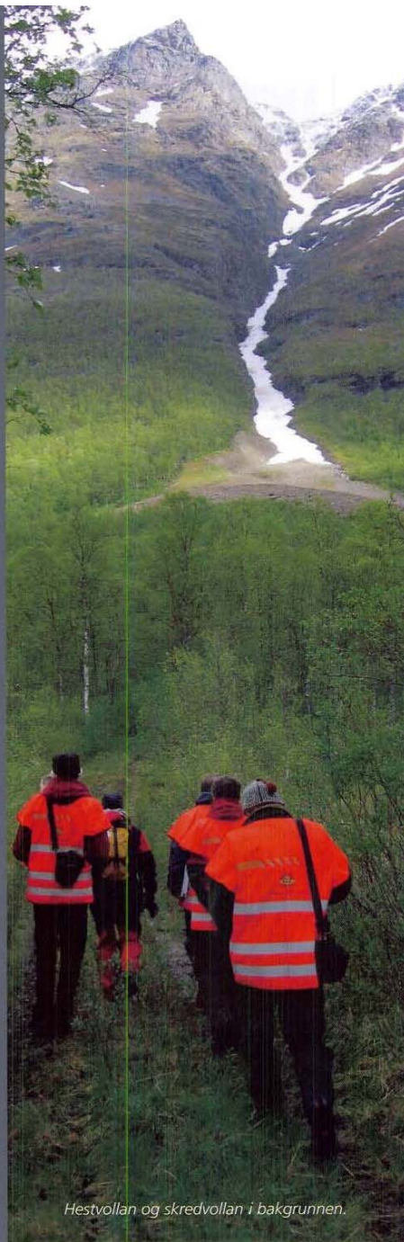
Hestvolla og skredvolla i bakgrunnen.