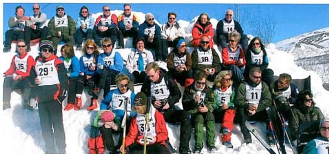
God stemning på suppestasjonen.

Søndag gikk med til restitusjon og pakking, samt en liten skitur. Så bar det tilbake til lavlandet og våren.