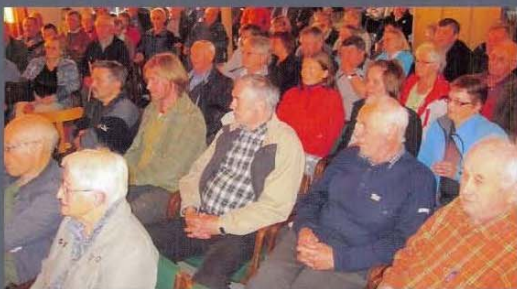
Stort oppmøte på Grendehuset i Ramfjorden.