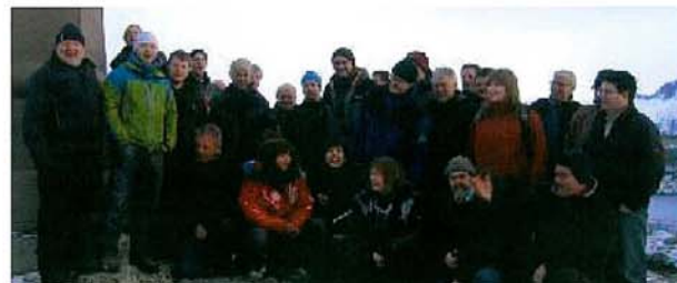
De fleste av deltakerne og kursledelsen samlet ved Kongebautaen ovenfor Saltstraumen.