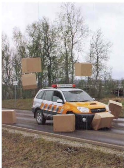
in Synnøve Elvevoll i farta.