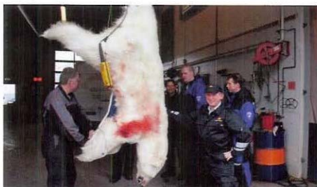
Kontroll av bjørn.

av noen forskere oppe på nordaustlandet. Bjørnen ble hentet ned til sysselmannen på tirsdag. Selv om dyret var død var dette en eksotisk opplevelse som ikke så mange får anledning til å overvære (ikke oss fra fastlandet i hvert fall). Slikt skjer vel bare en tre fire ganger i året; har jeg hørt. Bildene forteller resten.