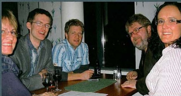
Sosial bolk med middag og quiz på regionvegkontoret.

Den 31. mars og 1. april ble årets første introduksjonssamling for nyttilsatte i regionen arrangert i Bodø. Til sammen 25 personer var på plass ved Thon Nordlys Hotel i Bodø. Årets samling hadde deltakelse fra samtlige distrikt (unntatt Midtre Hålogaland), ressurs, utbygging, veg og trafikk, strategi og administrasjonsavdelingen.