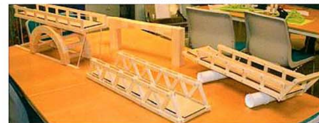
De 4 bruene ble bygget i trematerialer fra kassene.

Etter at de var ferdig, ble de trykkprøvet.