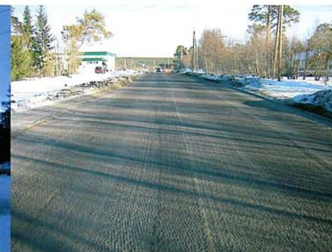
Og sånn ble resultatet.