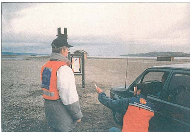
Synstesttavler ble satt opp fire plasser i fylket høsten '96. Her fra åpningsdagen på Bjørnnes utenfor Lakselv.